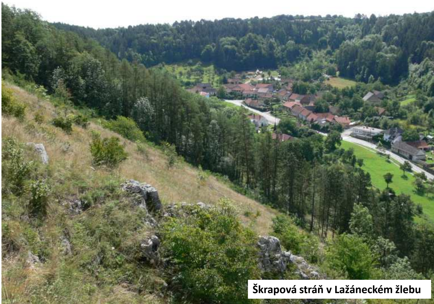
Škrapová stráň v Lažáneckém žlebu