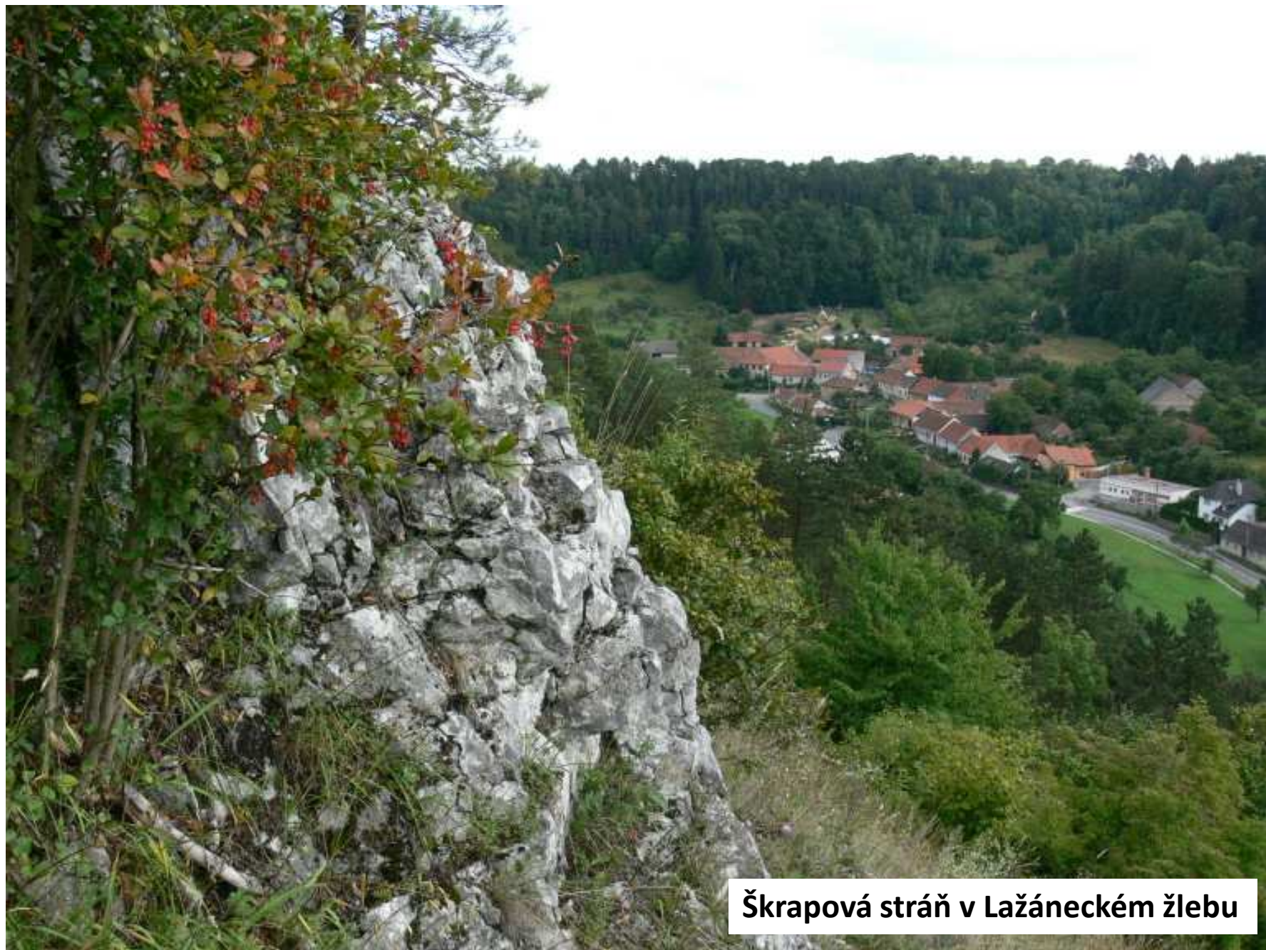
Škrapová stráň v Lažáneckém žlebu